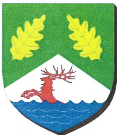
Projet de Blason a Saint Mesmin